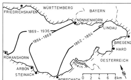
Abb. 4: Linienführung der ersten Telegraphenkabel im östlichen Bodensee. Rutschungen von Rheindelta-Sedimenten verursachten verschiedene Kabelbrüche. Erst in genügender Entfernung vom Delta konnte der Betrieb störungsfrei aufrechterhalten werden.

Die Ergebnisse werden jeweils von der Internationalen Rheinregulierung in einem aufschlussreichen Bericht veröffentlicht; sie sind in der Tabelle zusammengefasst. Der Rhein schüttete von 1911 bis 1979 im Jahresmittel rund 3 Mio. \text{m}^3 Feststoffe in den Bodensee. Zum Vergleich: die ägyptische Cheops-Pyramide hat ein Volumen von 2\frac{1}{2} Mio. \text{m}^3 .