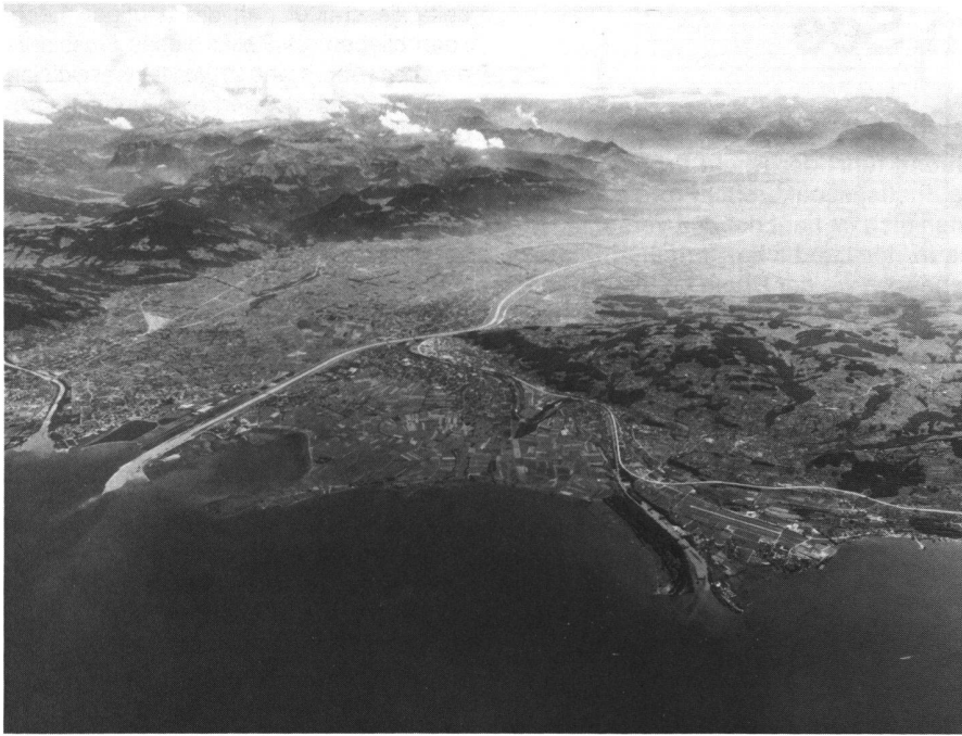
Abb. 2: Flugaufnahme des Rheindeltas im Bodensee (21. August 1975). Blick nach Südosten. Links münden die Bregenzer Ache und der trübe Rhein in die Hard-Fussacher-Bucht. Mitte rechts erkennt man den Mündungstrichter des Alten Rheins.

ner Schüttungszeit von etwa einem Jahrtausend entsprechen würde und so mit dem historischen Befund, dass sich der Rhein bereits im 9. Jahrhundert bei Rinisgemünde (dem heutigen Altenrhein) in den Bodensee ergoss, im Einklang steht.