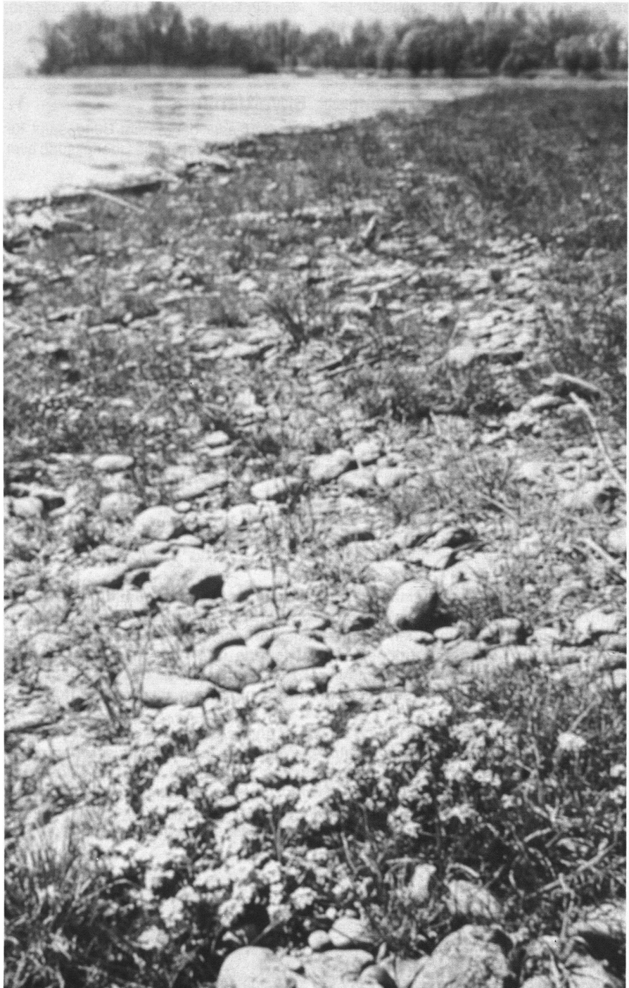
Abb. 2: Strandrasen am Bodensee. Karger Lebensraum für seltene Tiere und Pflanzen.

Ist Ihnen auch schon aufgefallen, dass am Bodensee die dem Schilfgürtel normaler-