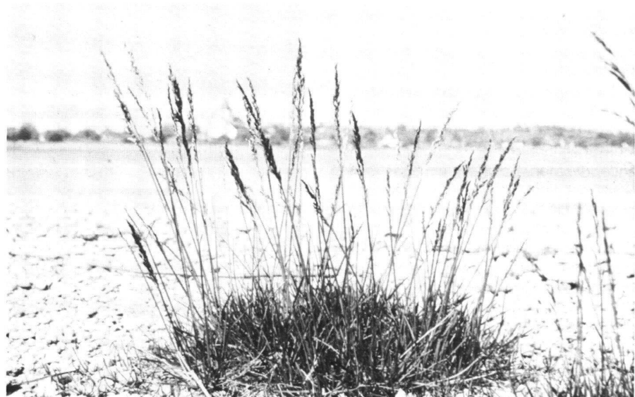
Abb. 1: Die Strandschmiele ist nur am Bodensee heimisch, aber leider sehr stark bedroht.

– von Westen, z.B. entlang der Juraberge oder über das Walenseegebiet durch das Rheintal an den See