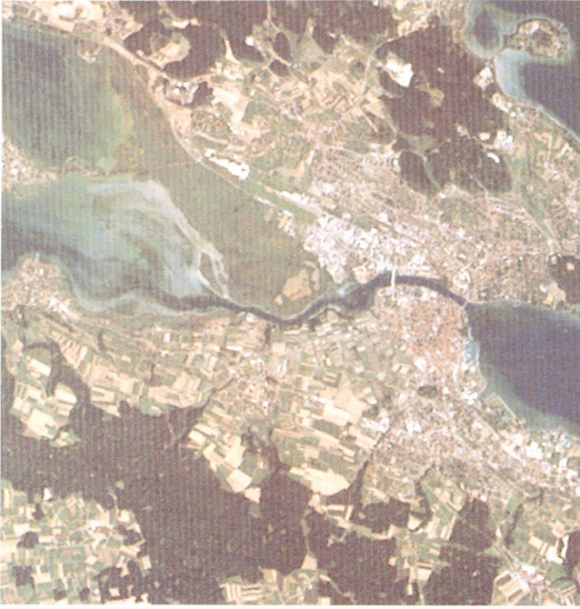
▼ Abb. 1: Region St. Gallen, aufgenommen vom Erderkundungssatelliten SPOT-1 (Pan) mit 10 m Bodenauflösung am 30. Sept. 1986