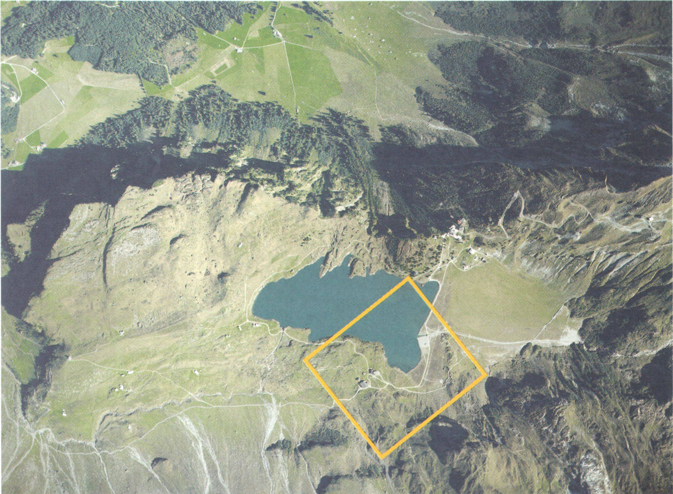
Abb. 3: Luftbild: Trüebsee (verkleinert)

Kamera RC 20 Flughöhe 4800 müM Höhe ü. Grund ca. 3000 m