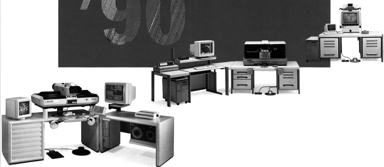
PHOTO GRAM METRY '90

Leica AG Kanalstrasse 21 · 8152 Glattbrugg · Tel. 01/809 33 11 Rue de Lausanne 60 · 1020 Renens · Tél. 021/635 35 53