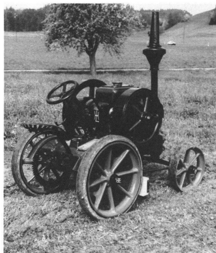
Abb. 2: Traktor-Pionier «Lanz», 1921.

Ein reich illustrierter Museumsführer erläutert die Ausstellungsobjekte und agrargeschichtliche Aspekte.