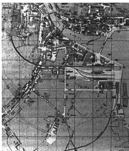
Abb. 1: Luzern 1890: Zentralbahnhof und Brünigbahnhof.

Das Thema «Bahnhof-Architektur» soll also in einen Bezug zur ursprünglichen Funktion des Reisens und zur Entwicklung der Stadt Luzern gesetzt werden. Vielleicht gelingt es dadurch, die jeweilige Gestaltung der Bahnhöfe verständlicher und einprägsamer darzustellen.