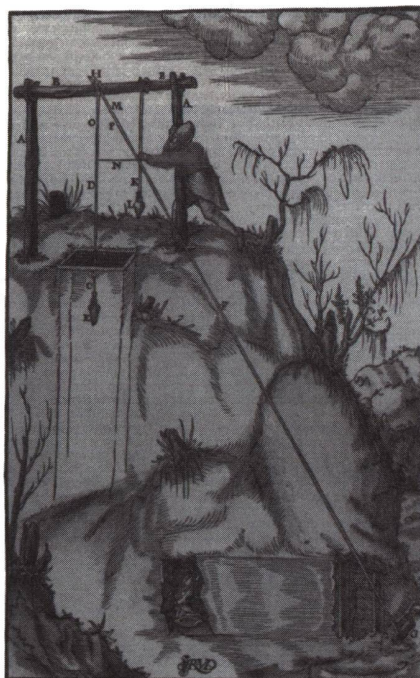
Abb. 1: Markscheiderische Vorausbestimmung der Schachttiefe und Stollenlänge am Durchschlagspunkt von Schacht und Stollen (aus: G. Agricola «De re metallica», Basel 1556).

Zur direkten Messung von Strecken dienten hauptsächlich Messschnüre aus Hanf, Lindenbast oder Draht, später auch Messketten. Die Schnüre (Verziehschnüre) wurden auf der Streckensohle gespannt. Als Masseneinheiten wurden Klafter, Lachter oder andere Längeneinheiten benutzt. Bei der direkten Messung von Schachttiefen fanden