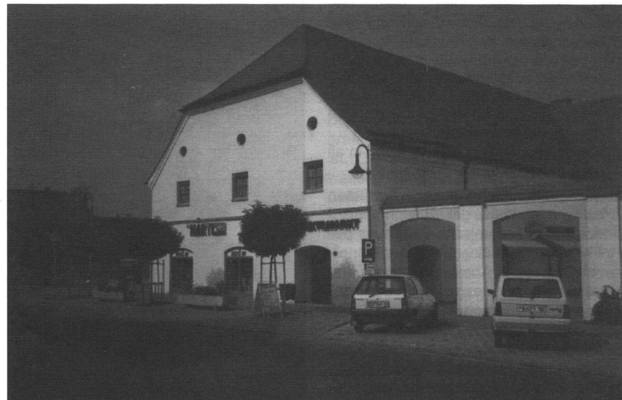
Abb. 3 und 4: Dorferneuerung Arnstorf: Ehemaliger Kuhstall des Schlosskomplexes vor und nach der Renovation; heute als Elektro- und Textilgeschäft genutzt (ausgezeichnet mit dem Europa-Nostra-Verdienstdiplom 1990).

sichtlich läuft bereits alles längst in dieser Richtung. Anders als in Deutschland sind wohl in der Schweiz bereits viele der neuen Erkenntnisse und Botschaften längst realisiert und verinnerlicht und, wie im Eingangskapitel aufgezeigt, jahrhundertelange Praxis. Das Prinzip der kleinen Einheit, Politik von unten nach oben und die partizipatorische Demokratie sind ein Gütezeichen für die Schweiz und brauchen nicht erst den Transmissionsriemen der mitteleuropäischen Dorferneuerungsbewegung, um von Schweizer Politik und Gesellschaft erkannt zu werden.