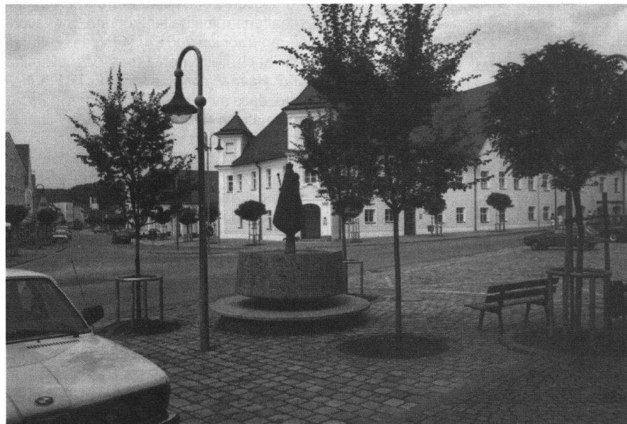
Abb. 1 und 2: Dorferneuerung Arnstorf: Schlossgebäude am Marktplatz vor und nach der Renovation des Schlosses und der Neugestaltung des Marktplatzes.

Stadtkinder in kleine Häppchen, die den Verlust der Ganzheitlichkeit des Kinderalltags zur Folge haben. Wie sollen aus dieser nächsten verantwortlichen Generation jemals Begeisterung und Engagement für ganzheitliche Umweltbewahrung erwachsen?