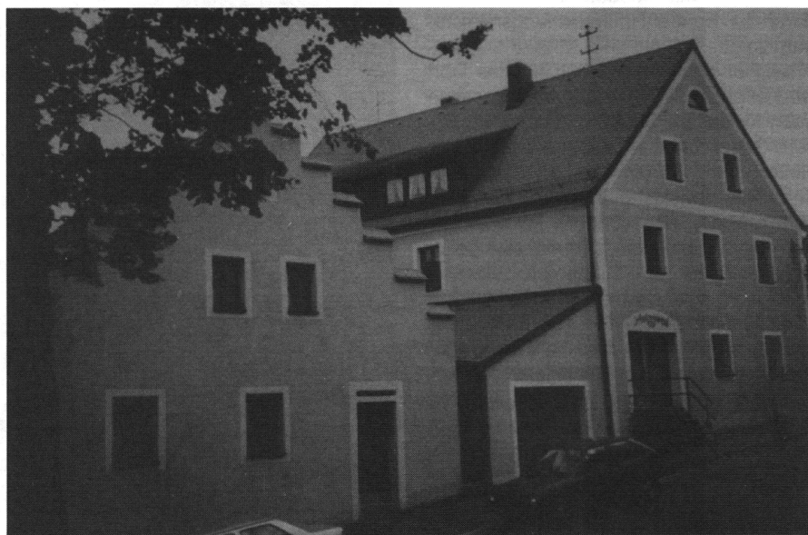
Abb. 5 und 6: Dorferneuerung Leuchtenberg: Gasthof mit eigener Metzgerei vor und nach der Renovation.