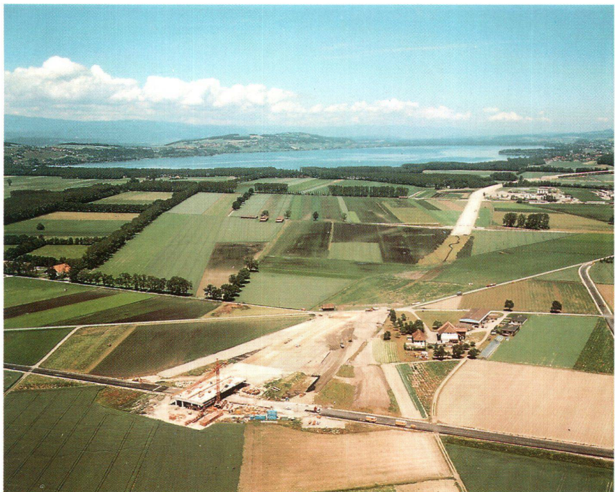
Fig.: Route nationale N1 en construction.

Adresse de l'auteur: J.-P. Parisod Ingénieur EPF CH-1580 Avenches