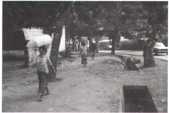
Fig. 3: Equipement de voirie au centre ville de Conakry. Evacuation des eaux de surface.