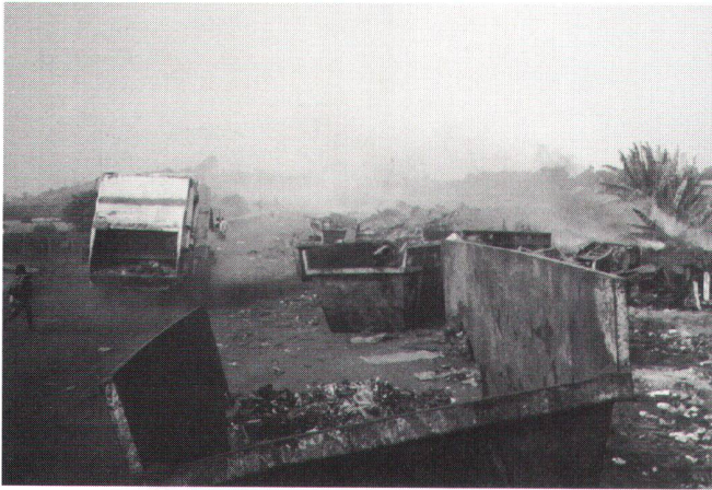
Fig. 2: Gestion des ordures ménagères en ville de Conakry. Réaménagement de la décharge.