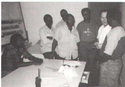
Fig. 1: Audit de la division du garage du service de la voirie (UPSU) à Conakry.

souhaite exporter biens ou services. La continuité dans la prospection et dans les activités est le moyen le plus sûr de se donner des chances réelles de succès sur les marchés de l'exportation caractérisés par une concurrence extrêmement dure, et où le facteur risque est toujours présent. La permanence sur place est en général assurée par une société partenaire locale qui est souvent une filiale de la société exportatrice. Ce qui permet d'assurer de façon durable le transfert et le maintien du savoir faire.