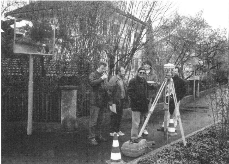
Abb. 2: Pkt.400: Messungen nur März 1992 (wegen Vegetation im Juni nicht möglich).

(überbautes Gebiet, Baumbestand) reduzieren die Satellitenanzahl mehrheitlich auf 4.