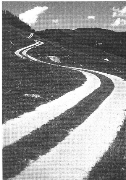
Spurweg bei Zillis.

Die Betonstrassen AG (BeAG) in Wildegg wurde 1929 gegründet. Ihre primäre Aufgabe war, den Betonstrassenbau in der Schweiz zu propagieren und zu fördern. Die Mitarbeiter der BeAG standen allen im Strassenbau Verantwortlichen beratend zur Seite und unterstützten sie durch eigene technologische und verfahrenstechnische Forschung.