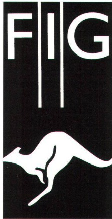
FIG-Kongress 1994 in Melbourne