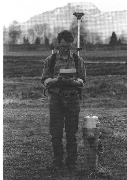
Mobiles Empfangssystem SR260/CR233/AT201 für GIS-Kartographie.

Mit den neuen GPS-Einfrequenz-Empfängern WILD SR261/SR260 mit der externen GPS-Antenne WILD AT201 wird das WILD GPS-System 200 von Leica modular erweitert. Während die bisherigen GPS-Zweifrequenzsensoren SR299/SR299E vor allem für Vermessungen im mm/cm-Genauigkeitsbereich eingesetzt wurden, sind die neuen Einfrequenz-Empfänger eine preisgünstige Alternative je nach Anwendung und Anforderungen. Die 6-Kanal-Empfänger messen über den C/A-Code die Pseudodistanzen und der SR261 zusätzlich an der L1-Trägerfrequenz die Phase. Die SR261/SR260 werden mit einem 2,8 m Antennenkabel mit der externen GPS-Antenne WILD AT201 verbunden und das System durch die bisherigen GPS-Controller WILD CR233 oder CR244 gesteuert. Alles weitere Zubehör ist ebenfalls kompatibel zum bisherigen WILD GPS-System 200 mit dem SR299(E). Beim