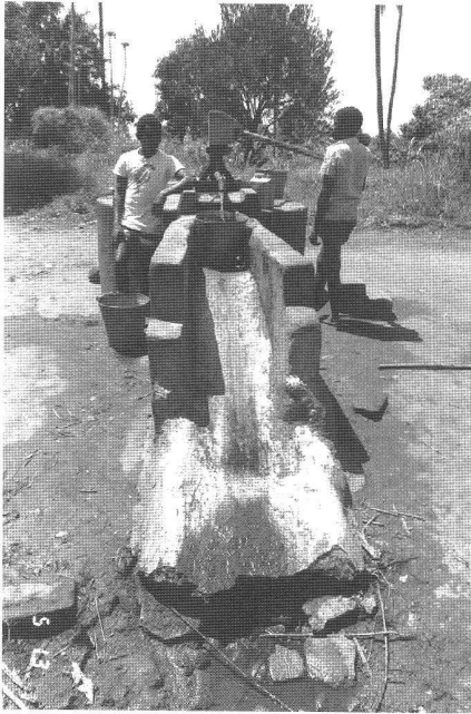
Abb. 2: Einfache Handpumpe als Zapfstelle ausgestaltet, Tanzania, Kilombero Distrikt.

handlung wäre der Effekt einer reduzierten Schneckenpopulation erst nach Jahren sichtbar.