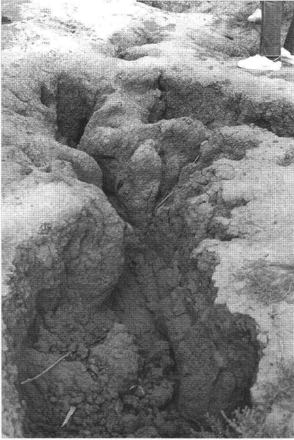
Abb. 2: «Innerer» Kollaps von instabilen Böden nach ungeeignetem Reisanbau unter Bewässerung, Mauretanien, 1985.

den Zyklon «Cynthia» soll im Rahmen des Wiederaufbaus auch die Anbaustruktur neu überdacht werden.