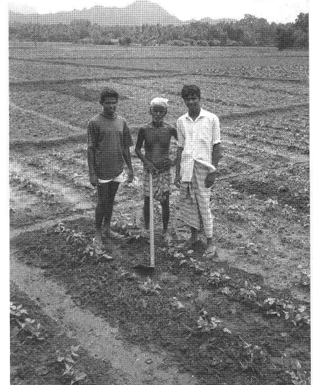
Abb. 4: Bewässerter Anbau von Mungbohnen ( Phaseolus radiatus ) in Reisbecken während der Trockenzeit, Sri Lanka, 1991.