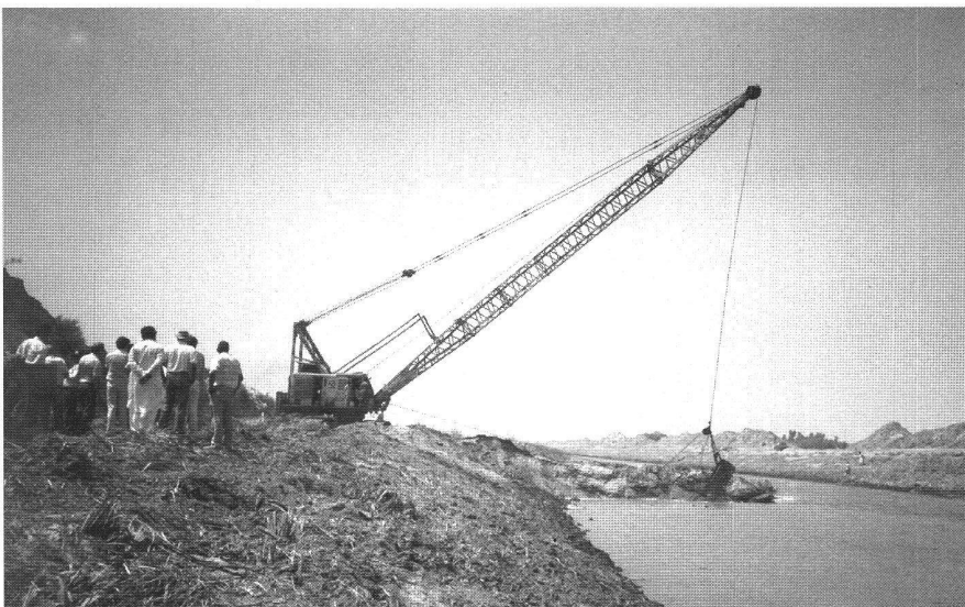
Abb. 3: Ausbaggern von Sedimenten aus Hauptzuleitern; Sindh-Pakistan, 1993.

Die Liste ähnlicher Beispiele liesse sich fortsetzen anhand von Projekten in Pakistan (Abbildung 3), den Golfstaaten, Ozeanien und Afrika.