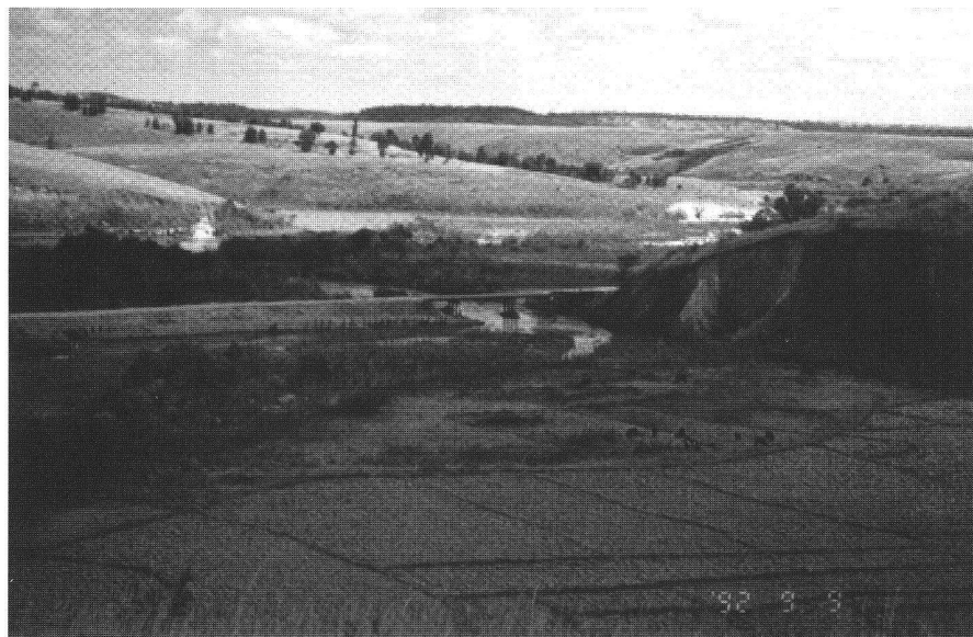
Abb. 1: Die Brücke von Ranofotsy.

Bei unserer Ankunft begann man gerade mit den ersten Arbeiten, indem man die ärgsten Stellen mit schweren Maschinen ausbesserte, um die Baustellen überhaupt zugänglich zu machen. Einer dieser «points noirs» war die Brücke von Ranofotsy. Ein Teil des einfach gebauten und einspurigen Bauwerkes wurde bei einem Hochwasser weggerissen und durch eine atemberaubende Holzkonstruktion ersetzt. Für uns war es ein spannendes Erlebnis zu beobachten, wie sich das Provisorium unter den überladenen Reistransportern knarrend neigte, als würde es im nächsten Augenblick zusammenstürzen. Im Rahmen des Projektes sollte die Brücke ersetzt werden. Um die Dauerhaftigkeit des Neubaus zu gewährleisten, sah man zusätzlich einen Uferschutz durch Blockwurf vor. Es ist jedoch zu befürchten, dass diese Massnahme nicht genügt, da mit sehr grossen Hochwassern gerechnet werden muss. Die Strasse liegt nämlich in einem völlig entwaldeten Gebiet. Der Humus ist bis auf das Muttergestein, auf dem noch einige wenige Gräser gedeihen, ab-