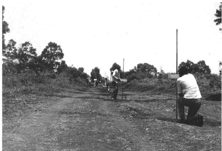
Abb. 4: Arbeitsintensiver Strassenbau.

Im Projekt (ehemals ein Helvetas- und heute ein DEH-Projekt, welches Bestandteil des Minor Roads Programme ist) wurde ich grosszügig und offen empfangen. Da ich jedoch kurzfristig ins Projekt kam, mussten in den ersten Tagen in gemeinsamer Arbeit mit den lokalen Projektverantwortlichen mögliche Arbeitsthemen besprochen und ihre Realisierbarkeit auf dem Feld überprüft werden. Im Verlauf der zweiten Woche konnte ein endgültiger Entscheid über meine Aufgabe gefällt werden. Im Bereich des ländlichen, arbeitsintensiven Strassenbaus (Labour Based Roads Construction), also des Strassenbaus ohne Einsatz von Maschinen, sollte ich eine in Botswana entwickelte Methode zur Absteckung des Längenprofils an die lokale Situation anpassen, dazu eine kleine Machbarkeitsstudie durchführen und einen Vergleich zur bestehenden, einfacheren Methode anstellen. Dabei wurde bei den bisher erstellten ländlichen Strassen lediglich das Bett quer zur Strasse mit Pikel und Schaufel eingeebnet, wobei der Längsverlauf weitgehend dem vorgegebenen Geländeverlauf folgte. Bei hügeliger Landschaft führt das zu einer gefährlichen und bezüglich des Fahrzeugunterhalts teuren Strasse. Deshalb sollte erprobt wer-