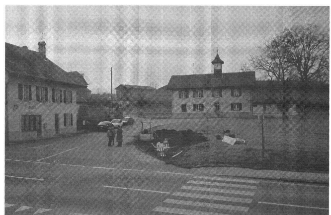
Vue du chantier d'aménagement de la place publique près de la poste (à gauche) et du collège (au fond).