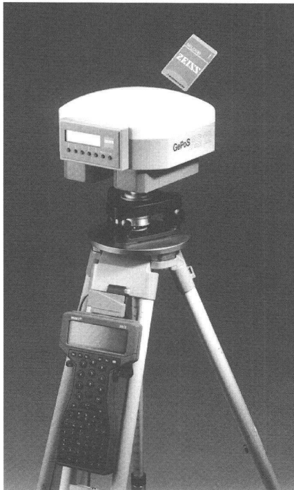
Neuer GPS-Empfänger GePoS RS 12 von Carl Zeiss.

Mit dem GPS (Global Positioning System)-Empfänger GePoRS 12 bietet Carl Zeiss eine Messtechnologie der Kompaktklasse: Antenne, Empfänger, Bedienfeld, Anzeige und Speicherung der Daten bilden eine Einheit in einem handlichen, wasserdichten Gehäuse. Zu einem attraktiven Kosten-Nutzen-Verhältnis bedeutet das Mess- und Auswertesystem GePoS die Lösung für viele Anwendungen.