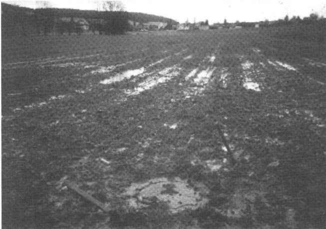
Abb. 1: Staunässe verursacht durch Bodenverdichtungen.