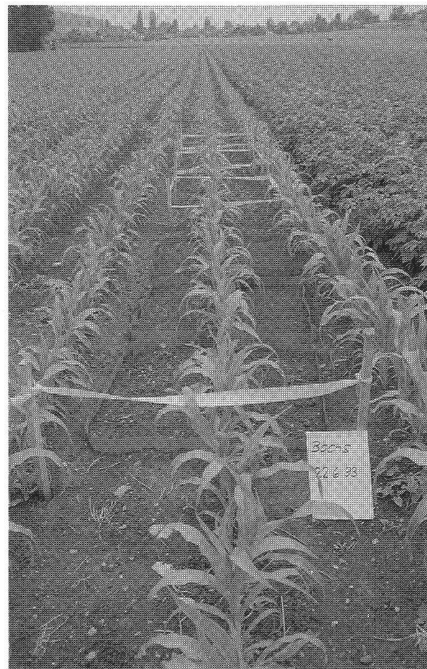
Abb. 4: Kartoffeln und Mais, Überprüfung der Krümelstabilität.

In der Regel kommen bei einer vernässten Fläche nicht alle Arbeiten zur Ausführung. Das Ziel der in Bachs ausgeführten kombinierten Drainage bestand darin, die Voraussetzung für eine angepasste ackerbauliche Nutzung bereitzustellen. Die umfangreichen Meliorationsmassnahmen, mit Rohr- und Schlitzdrainage, teilweise unterstützt durch Maulwurfdrainagen, Kalkung und Tieflockerung, mit Kosten von rund Fr. 30 000.– pro ha, erfüllen die geforderte Aufgabe nur zum Teil.