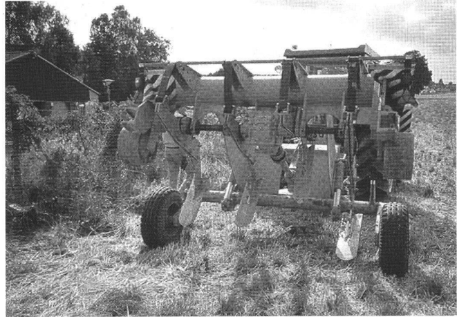
Abb. 2: Tieflockerungsgerät MM 100.

wärts kamen ein Streifen Mais und ein Kartoffelacker zu liegen.