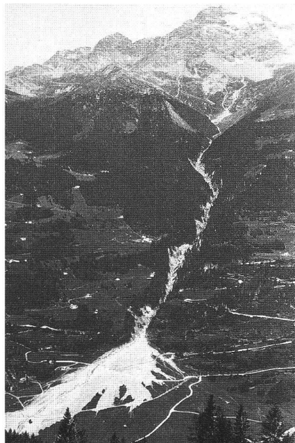
Abb. 10: Das erodierte Gerinne im Val Varuna nach dem Murgangereignis vom 18./19. Juli 1987 (Foto A. Godenzi, Chur).

Eine von uns seit vielen Jahren betriebene Grundlagenforschung ist jene der Tsunamis. Zwar bearbeiten wir nicht die von Erdbeben erzeugten Schwallwellen in stehenden Gewässern, sondern die von Uferinstabilitäten wie Bergstürze, Hangrutsche, Lawinen, Gletscherabbrüche und Murgänge verursachten. Angesichts der Vielfalt der Parameter ist es nie leicht, die Wellenbildung in Seen, Stauseen und Meeresbuchten vorauszusagen.