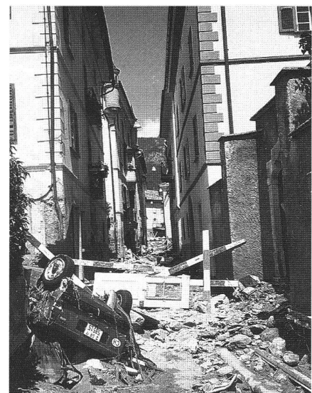
Abb. 12: Ein Tag nach der Unwetterkatastrophe vom 20. Juli 1987 in Poschiavo, Graubünden.

Von der Entstehung der durch Uferinstabilitäten erzeugten Tsunamis war schon die Rede. Die schnelle Translation dieser langen Wellen wurde und wird von uns