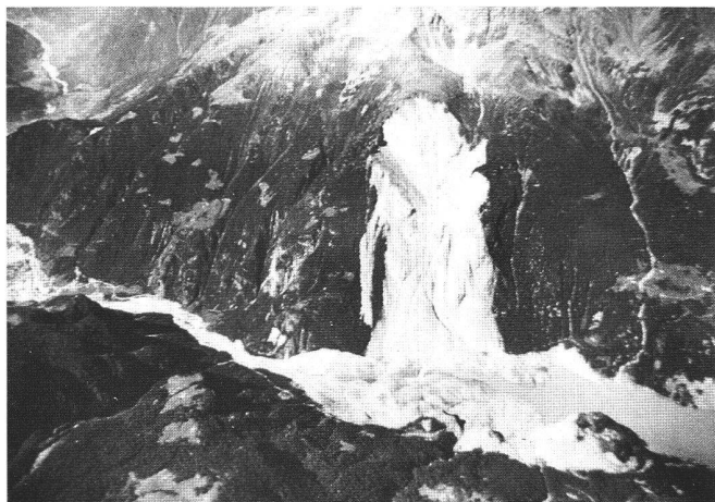
Abb. 13: Bergsturz im Veltlin am 28. Juli 1987.