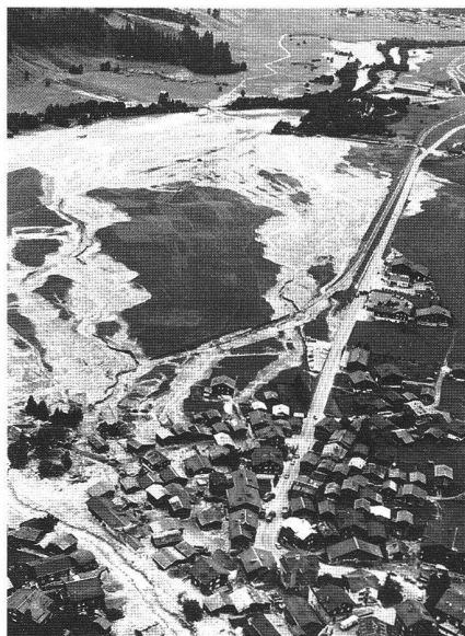
Abb. 11: Murgangspuren in Münster, Wallis, am 27. August 1987.