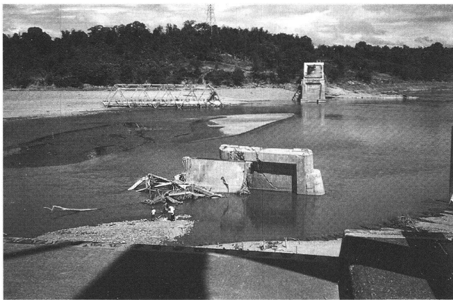
Abb. 5: Eine durch die Flut zerstörte Brücke über den Abra River, Philippinen.