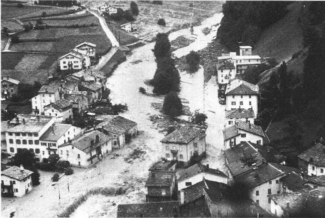
Abb. 3: Überschwemmung in Poschiavo 1987.