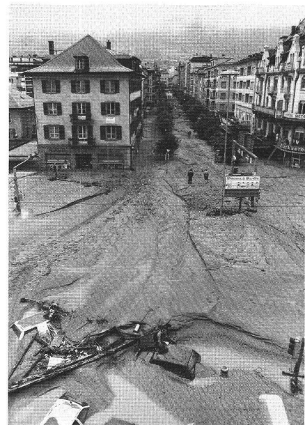
Abb. 2: Überschwemmung in Brig am 24. 9. 1993.

stehen die Wald- und Steppenbrände in einigen Fällen auf natürliche Weise durch Blitzschlag, in andern jedoch durch fahrlässige oder vorsätzliche Brandstiftung. Zum Wesen der Naturkatastrophen gehört auch eine gewisse Seltenheit, Unberechenbarkeit und Plötzlichkeit des Auftretens. Eine Naturkatastrophe wird als Drama empfunden, übt also – wie es die Zahl der Schaulustigen vor Ort und am Fernseher jeweils unterstreicht – eine grosse Faszination aus. Davon ausgenommen sind nur die Dürre und Kälteeinbrüche, die sich eher schleichend bemerkbar machen und keine vergleichbare Aufmerksamkeit erfahren.