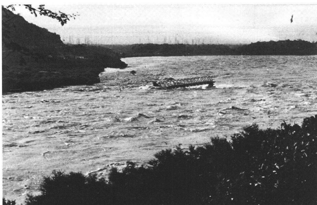
Abb. 7: Hochwasser im Fluss Jhelum in Pakistan am 10. 9. 1992.