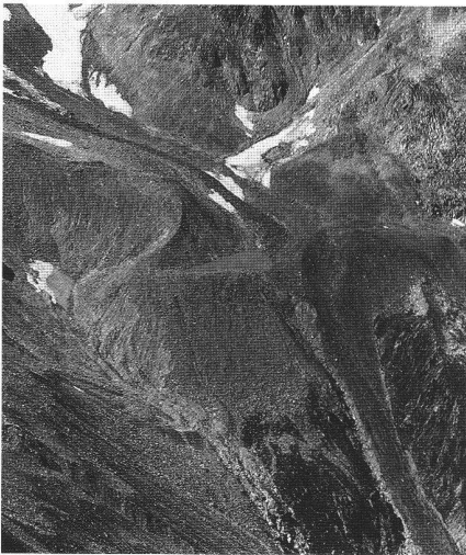
Abb. 9: Murganganrisse im Bereich historischer Moränen im Gerental/Goms.

tragen. Als Schutzkonzepte werden Rückhaltmassnahmen in den Einzugsgebieten untersucht und in Form von Regenmulden, Hochwasserdosierern und kleinen Stauseen konzipiert.