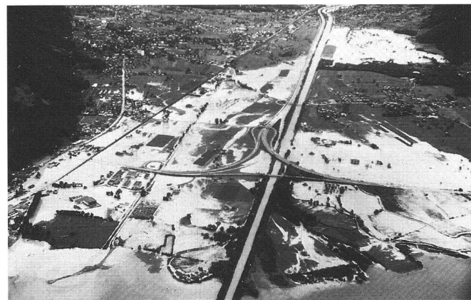
Abb. 8: Die überschwemmte Urner Reusebene am 25. August 1987.

den menschlichen Lebensraum, verheert diesen und bedroht des Menschen Gesundheit und Leben.