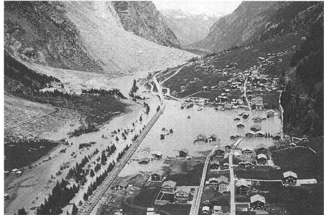
Abb. 4: Bergsturz in Randa, Aufnahme vom 17. 6. 1991.