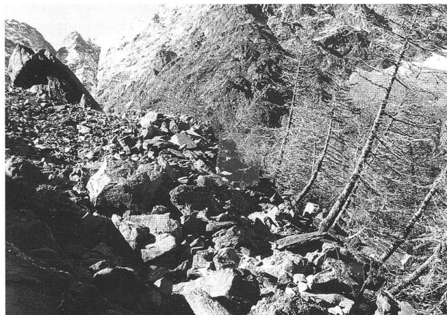
Abb. 14: Schuttbedecktes Eis des Ghiacciaio del Belvedere stösst in den Lärchenwald auf der Aussenflanke der historischen Seitenmoräne vor (1986).

weiter bearbeitet. Eine willkommene praktische Anwendung unserer Resultate ergab sich 1992 bei einer Sprengung an der Axentstrasse, die zu einem bergsturzartigen Gesteinseintrag in den Urnersee führte. Vor einigen Jahren widmeten wir uns noch der theoretischen und experimentellen Erforschung der Bewegung von sogenannten Sturzströmen.