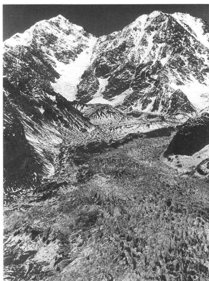
Abb. 15: Zunge des Glaciar Grande del Nevado del Plomo, Argentinien, unmittelbar nach einem Surge von drei Kilometern.

Selbstverständlich beansprucht die VAW kein «Copyright» auf dem Gebiet der Naturgefahren. Es gibt einzelne Naturgefahren mit denen wir uns überhaupt nicht oder nur am Rande befassen. Und bei jenen, die unserer Ausrichtung entsprechen und darum von uns behandelt werden, arbeiten wir häufig und gerne mit andern Stellen zusammen. Zu diesen zählen wir einmal die Institute der ETH