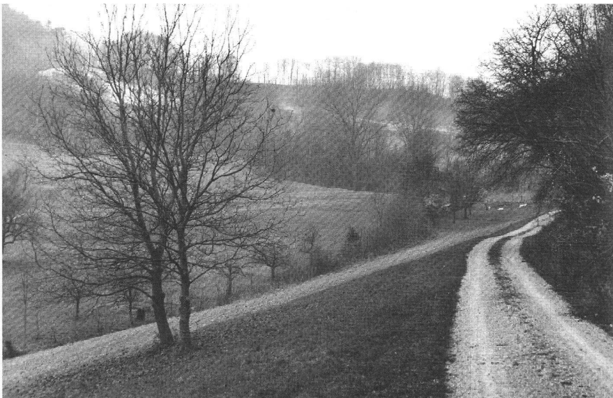
Abb. 2: Naturnahe Landschaftsgestaltung im Rahmen der Gesamtmelioration Asp im Kanton Aargau.