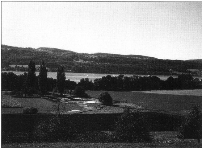
Abb. 3: Gesamtmelioration Greifensee, ZH: Dank naturnaher Umsetzung der Melioration entsteht am Greifensee ein neues Schutzgebiet.