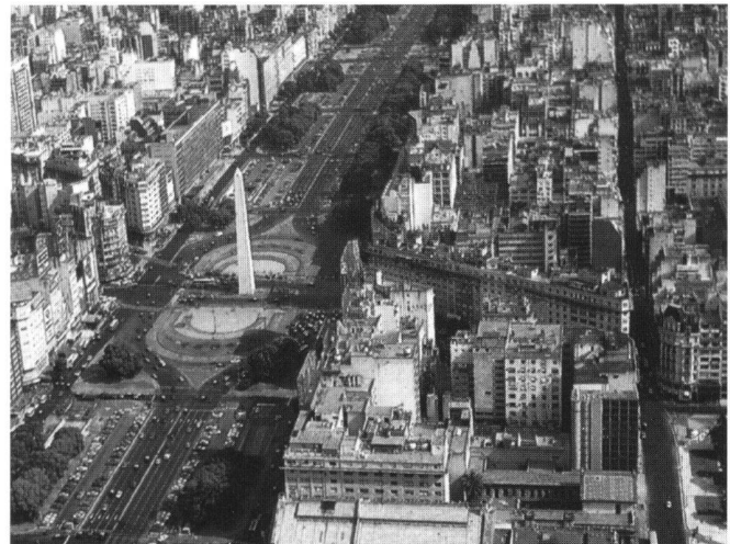
Abb. 2: Buenos Aires 1996.

Die Expedition von Pedro de Mendoza kam 1536 am Rio de la Plata an, gründete Buenos Aires und führte dann flussaufwärts dem Rio Parana entlang bis nach Paraguay. Ein deutscher Teilnehmer der Expedition beschrieb, «wie die Eroberung wirklich war»: