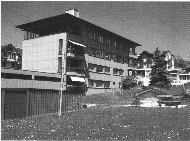
Abb. 1: Eines der drei Mehrfamilienhäuser, die mittels Erdsonde beheizt werden. Vorne rechts: Häuschen mit Erdsondenschacht.