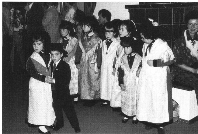
Groupe d'enfants de l'animation.

Wir freuen uns darauf, alle im nächsten Jahr in Muttenz wiederzusehen!