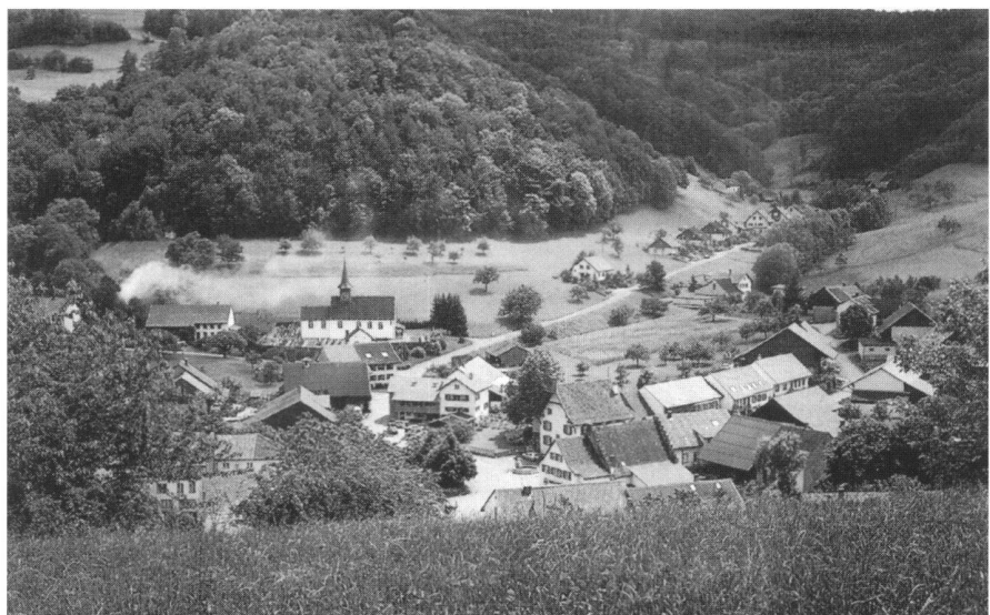
Kulturlandschaft Schenkenbergertal. Neben landwirtschaftlicher Nutzung, Weinbau und Forstwirtschaft hat die Natur viel Platz. Die kleinparzellierten Wiesen und Felder sind gesäumt von einzelnen freistehenden Bäumen. Eindrücklich sind die Buschgruppen, Hecken und Magerwiesen und die hochstämmigen Obstbäume.

Aus solchen Überlegungen heraus entstand die Idee einer «Werkstatt Schenkenbergertal», deren Aktivitäten in enger Zusammenarbeit mit Verbänden, interessierten Privaten