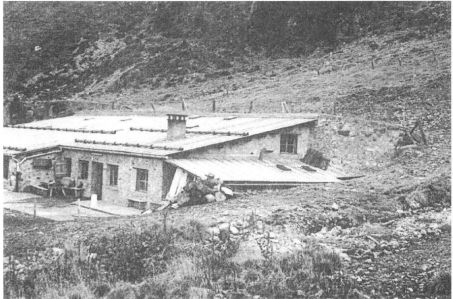
Alp Prasūra: Wasserturbine deckt Strombedarf.

dafür, dass bei geladener Batterie die überschüssige Energie zur Erwärmung des Boilers genutzt werden kann. Der Batteriespeicher ermöglicht einerseits einen rationellen, kostengünstigen, jederzeit verfügbaren Energieeinsatz, andererseits ermöglicht er die beim Melkvorgang und bei der Käsever-