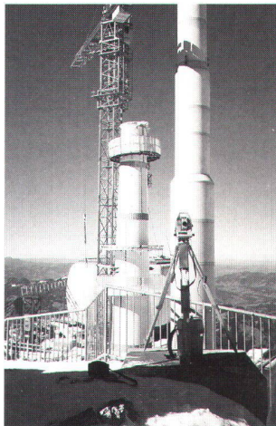
TCA 1800 im Baustelleneinsatz.

Vermessungssequipe der Schällibaum AG bereits routinemässig eingesetzt. Auf der Baustelle Säntis 2000, wo zum Teil unter schwierigsten Wetterbedingungen (Temperaturen unter dem Gefrierpunkt auch im Sommer, Schneefall, Regen) und unter grosstem Zeitdruck gearbeitet werden muss, kommen die Vorteile der automatischen Zielerfassung des TCA 1800 sowie der Fernsteuerung RCS 1000 voll zum Tragen. Die on board Software der Totalstation erhöht durch vielfältige Kontrollmöglichkeiten die Sicherheit der Absteckungen. Die