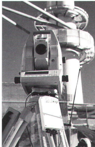
TCA 1800 mit Data Link.