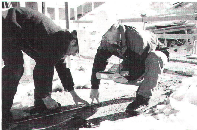
Absteckung ferngesteuert mit RCS 1000.

Mittlerweile wird die neu angeschaffte Ausrüstung durch die