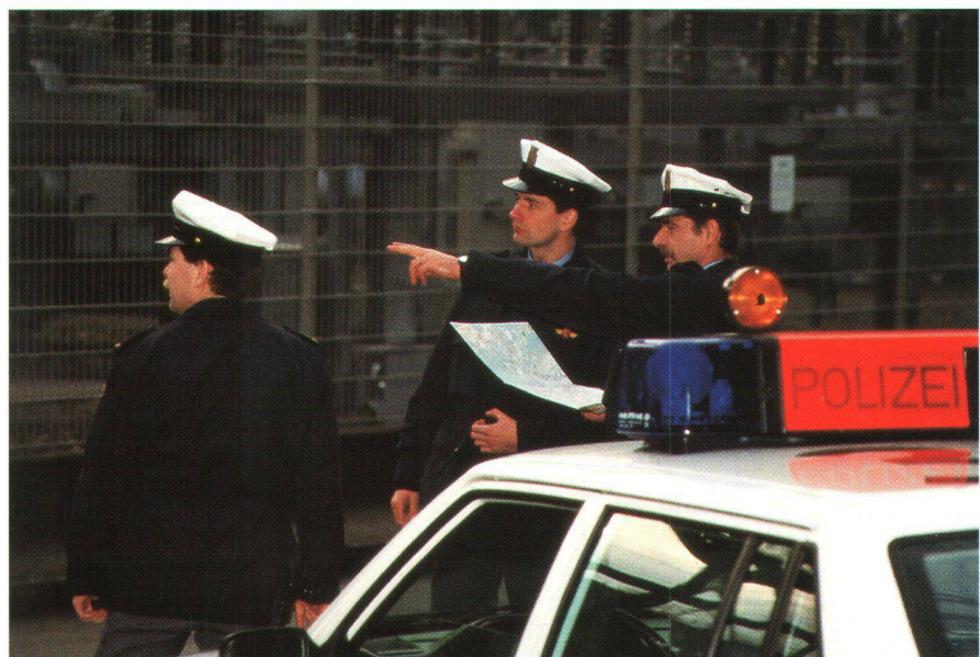
Abb. 1: NovaTrack: Element eines Einsatzleitsystems oder Flottenmanagements.

Wir ermöglichen Ihnen die geographische Verknüpfung Ihrer bestehenden Datenbanken und die Erfassung und Pflege von zusätzlichen Daten über spezielle Eingabemaschinen. Die Daten dieser Einzelplatz- oder Client/Server-Lösungen werden je nach Datenvolumen in Access oder Oracle gehalten.