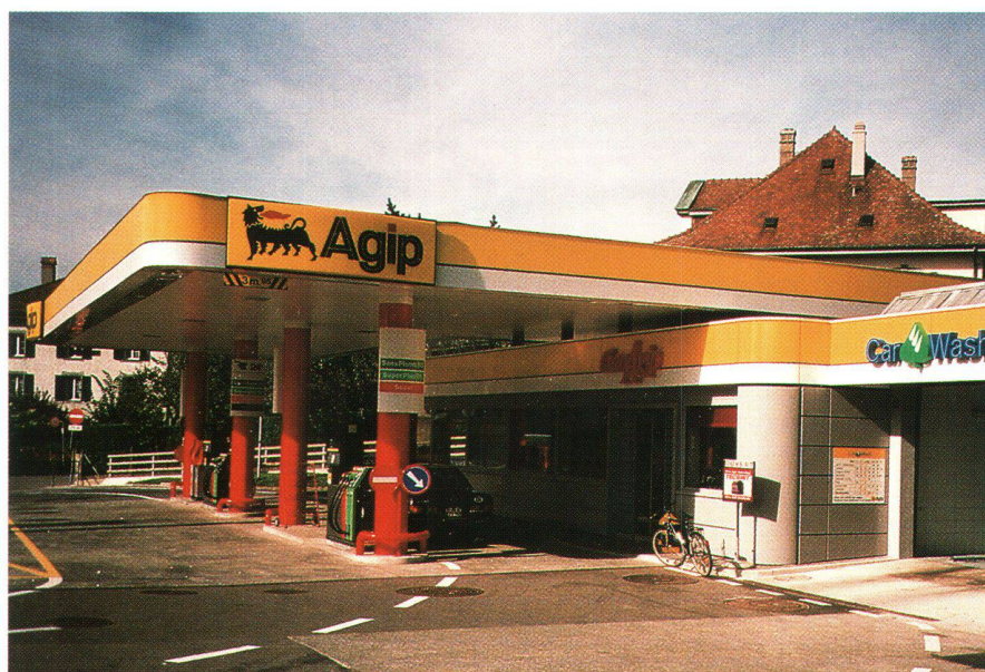
Fig. 3: AGIP gère son réseau de stations-services avec une application Novasys. Abb. 3: AGIP verwaltet und steuert Ihre Tankstellen mit einer Lösung von Novasys.

MapInfo est le leader mondial dans les solutions de Business Mapping et dispose