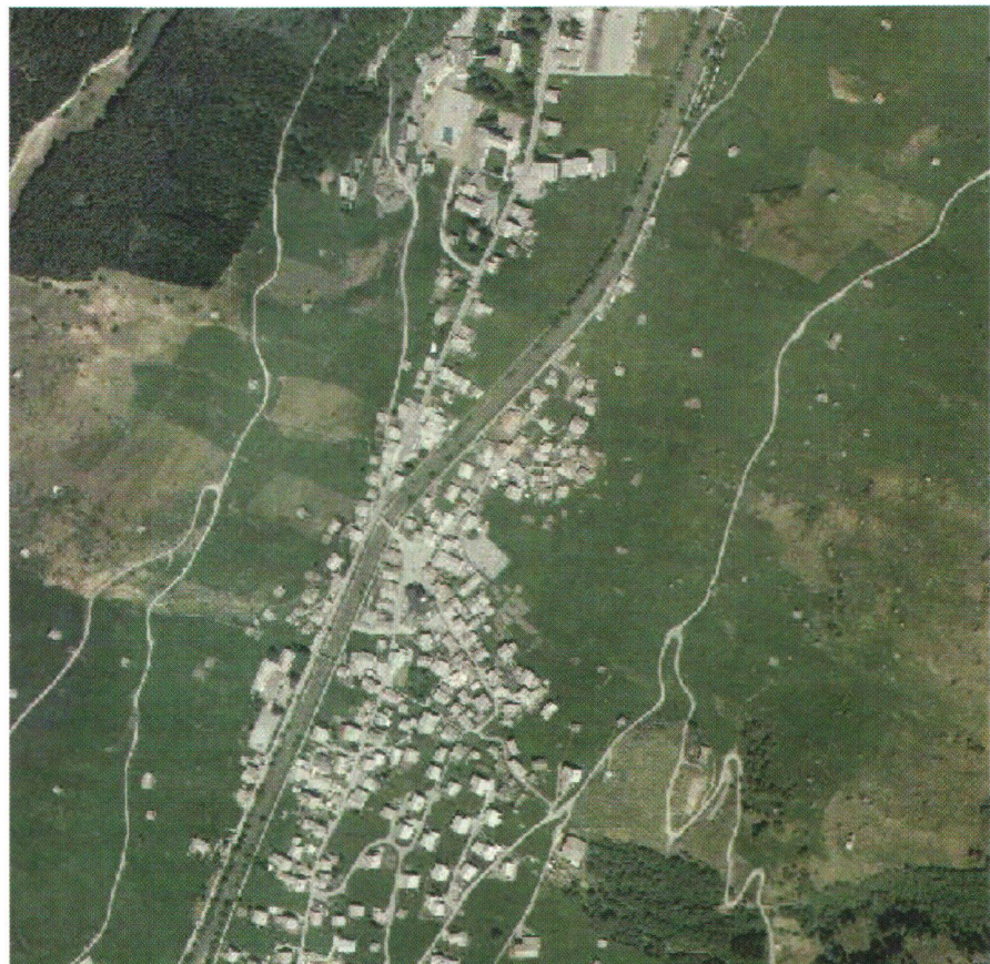
Abb. 1: Orthophotoausschnitt der Gemeinde Vals.

Das digitale Terrainmodell (DTM) wurde durch automatische Bildkorrelation in den digitalen Bilddaten (Stereomodell) an der DPW770 in einem 2 m Raster generiert. Anschliessend wurde der Datensatz von groben Fehlern durch manuelles Editieren in den am Bildschirm in 3-D dargestellten Höhenlinien bereinigt. Das DTM wurde durch zusätzliche Bruchkanten, die am