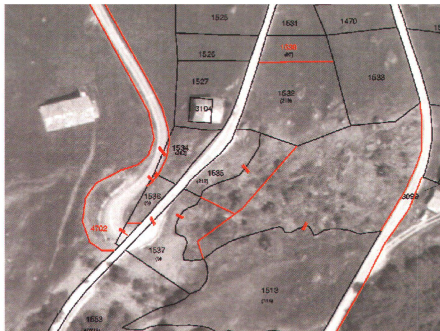
Abb. 3: Orthophoto mit Parzellarvermessung-Grenzbereinigung (Parzellengrenzen gemäss Blitzaktion-Vermessung 1979 in Schwarz, neue bereinigte Grenze in Rot, # aufzuhebende Grenze).