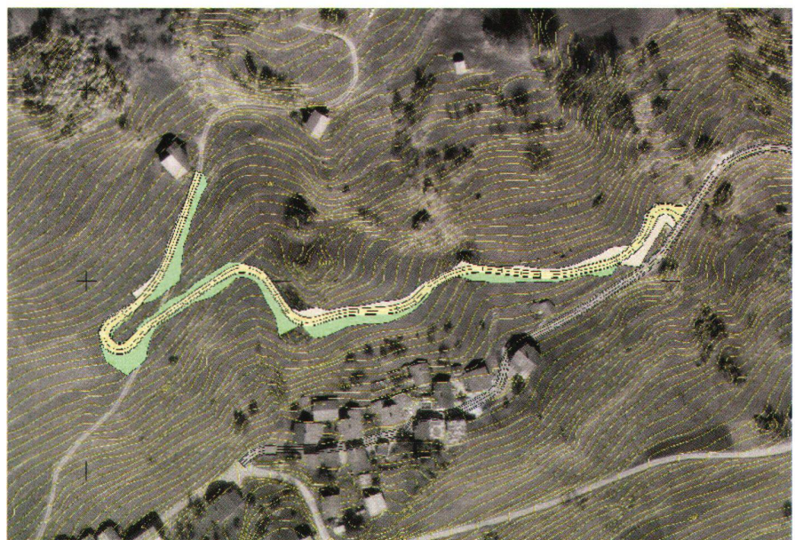
Abb. 5: Orthophoto und DTM mit Strassenbauprojekt der Gemeinde Dardin (Trasse in Gelb, Aufschüttung in Grün, Abtrag in Hellgrau, Äquidistanz der Höhenkurven 2 m).