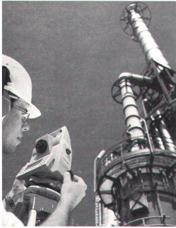
Abb. 2: TCR Instrumente ermöglichen Punktbestimmung und präzise Distanzmessung ohne Prismen bei schwer oder gar nicht zugänglichen Zielen.

meter-Programme sind die Modelle TCR und TCRM mit reflektorlos messendem Distanzmesser. Der koaxial integrierte Distanzmesser verfügt über einen roten, sichtbaren Laser als Sender. Die reflektorlose Distanzmessung bietet vor allem dort grosse Vorteile, wo Messobjekte nur schwer oder gar nicht zugänglich sind, z.B. bei Messungen über Schluchten oder Wasserläufe, bei Hochhäusern,