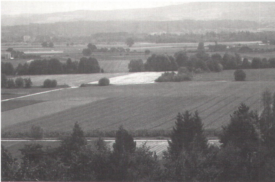
Östliches Seeland, Güterzusammenlegung Jens/Merzligen BE: Rationelle Produktion und ökologische Anforderungen: Zweckmässige Gewanneinteilung und ökologische Vernetzung.

Methode wird bei einigen neuen Projekten getestet. Im Weiteren löst die Wegleitung 1998 «Meliorationen im Einklang mit Natur und Landschaft» das bisherige Dokument «Natur- und Heimatschutz bei Meliorationen» (1983) ab. Bei der Erarbeitung der