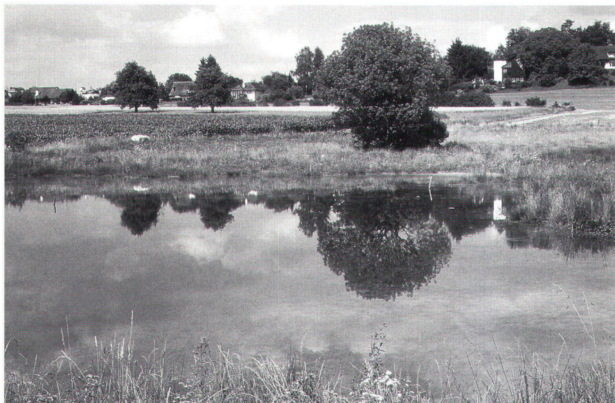
Abb. 2: Kernstück des Biotopverbundnetzes ist das 1,2 ha grosse Biotop in der «Chürzi». Im Sinne der landschaftspflegerischen Begleitplanung konnte das Biotop 1995 als Alternative zur ursprünglich geplanten Entwässerung dieser stets vernässten Geländemulde realisiert werden.