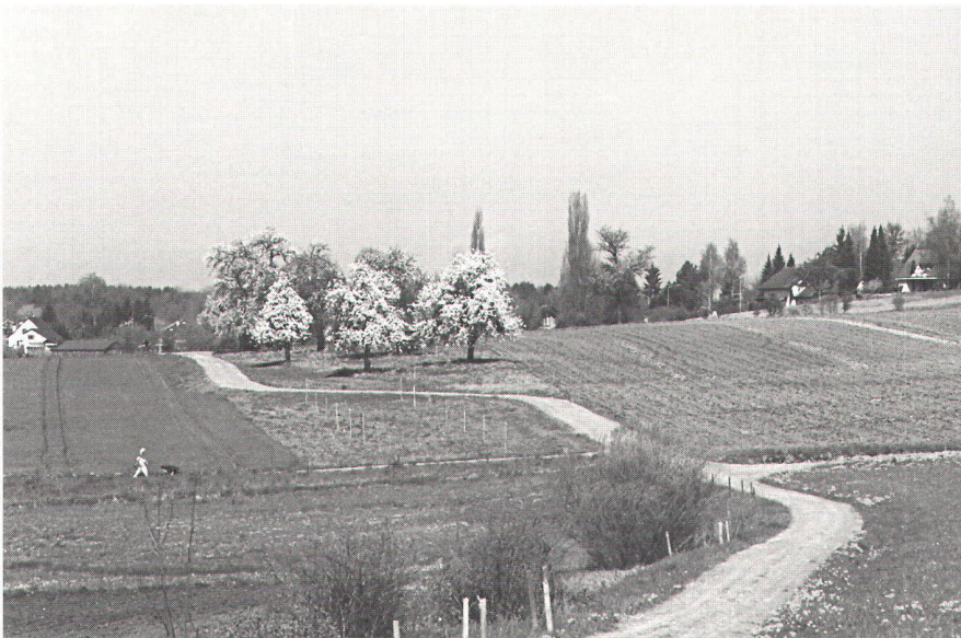
Abb. 3: Durch die Berücksichtigung der landschaftlichen Gegebenheiten bei der Wegnetzplanung konnte der bestehende Obstbaumbestand im Hintergrund erhalten und durch die Pflanzung zusätzlicher Hochstamm-Obstbäume im Vordergrund aufgewertet werden. Dank der geschwungenen Linienführung und der wechselseitigen Anordnung der ökologischen Ausgleichsflächen konnten die angrenzenden Ackerparzellen auch ohne die Anlage eines rechtwinkligen Wegnetzes optimal geformt werden.

Ausgleichsflächen anlässlich der schriftlichen Wünschäusserung und im persönlichen Gespräch bei der mündlichen Wunschentgegennahme