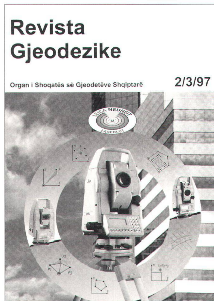
Abb. 3: Albanische Vermessungszeitschrift.

ten Tradition sind als bei uns. Hier gilt es für uns zu erkennen, wie sich Erfahrungen (der Berufsverbände) aus der Schweiz übertragen lassen, so dass diese auch umgesetzt werden können.