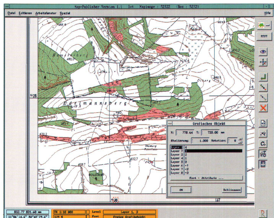
Abb. 3: Erstellung der Kartenrahmen, -netze und -beschriftung originalgetreu am Bildschirm.