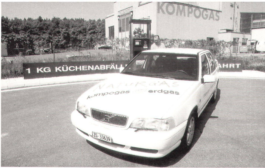
Abb. 2: Mit Kompogas betriebener Volvo S70 (Hybridfahrzeug) vor der Kompogas-Anlage und -Tankstelle in Bachenbülach (Foto: W. Schmid AG, Glattbrugg).

Deutschland und Österreich laufen bereits mehrere Kompogasanlagen. Weitere Vereinbarungen zum Bau von Kompogasanlagen unter Schweizer Lizenz sind unterschrieben, darunter zehn in Japan.