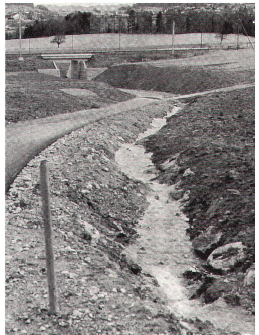
SBB-Unterführung mit neu geschaffenem Bach Aespis.

Es fand ein Wandel in den Köpfen statt. Denn die meisten Akteure sind seit über zwanzig Jahren dieselben. Dieselben, die noch vor zehn Jahren heftig und in aller Öffentlichkeit aneinander geraten waren, sind aufeinander zugegangen. Das ist bemerkenswert und stimmt besonders freudig. Natürlich brauchte es zunächst den Druck verbesserter Naturschutz-