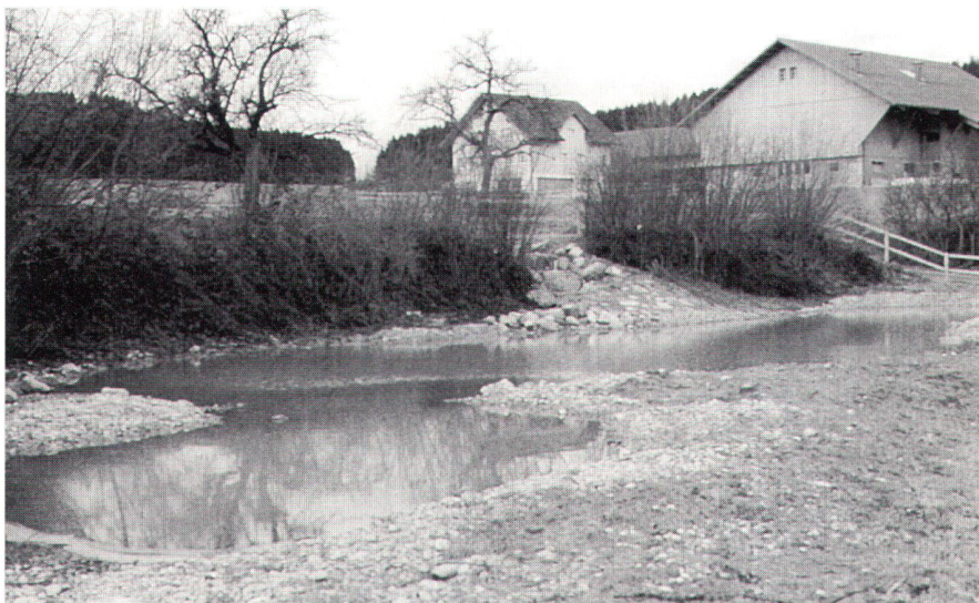
Melioration Kirchberg. Biotop und Aussiedlung Aespis.