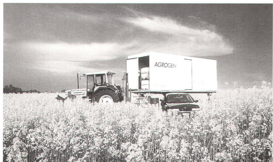
Abb. 3: Biotreibstoff-Produktionsanlage im Rapsfeld.

Tagungsband «Biotreibstoffe» Bundesamt für Energie, Markus Real (Hrsg.) Bezug: ENET, Postfach 130, 3000 Bern 16, Fax 031/352 77 56, Artikelnummer 30963. Hinweise zu Pilot- und Demonstrationsanlagen: Bundesamt für Energie 3003 Bern http://www.admin.ch/bfe