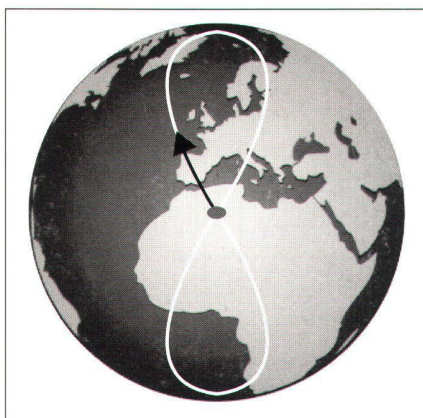
Fig. 3: Trace d'une orbite de type IGSO.

De nombreuses combinaisons de constellations sont à l'étude en tenant compte des coûts de lancement des satellites, des exigences des stations de contrôle et de la qualité de la configuration géométrique