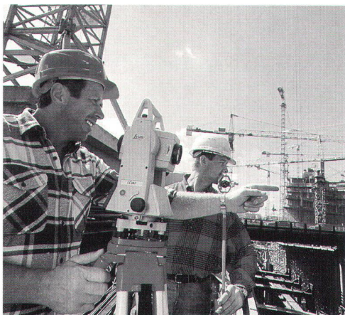
Leica TPS300 Basic Series: Konzipiert für die produktive Vermessungsarbeit auf Baustellen.

Leica Geosystems SA Rue de Lausanne 60 CH-1020 Renens Téléphone 021 / 635 35 53 Téléfax 021 / 634 91 55 http://www.leica.com