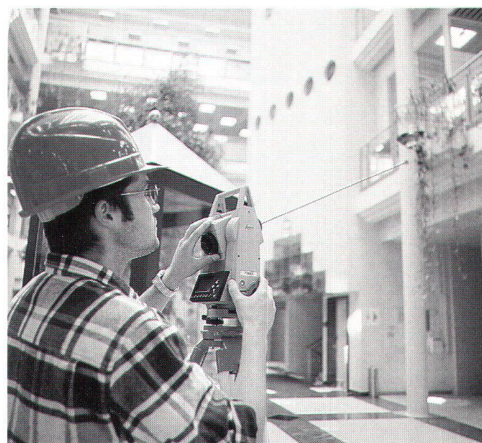
Neben klassischen Totalstationen umfasst die TPS300 Basic Series auch reflektorlos messende Totalstationen (TCR-Modelle) – eine echte Premiere in dieser Klasse!