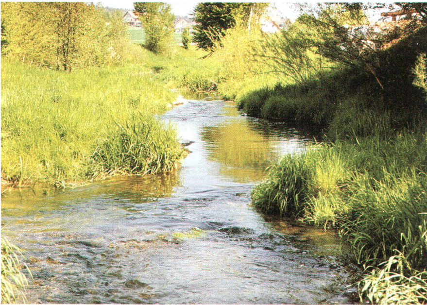
Abb. 1: Nefbach (ZH).

Fliessgewässern und zum Teil zu langdauernden Hochwasserständen in den Seen. In einer ersten Reaktion wird immer nach Schuldigen gesucht. Einfache Rezepte sind gefragt. Oft wird die Versiegelung der Landschaft als Ursache angeführt. Die Mechanisierung der Landwirtschaft mit der einhergehenden Verdichtung der Böden oder dann wiederum der Autofahrer, der Treibhausgase produziert und damit zur Klimaänderung beiträgt. In diesem Frühjahr nach den Rekordschneemengen kam auch der strenge Lawinenwinter ins Gerede. So ist es nicht verwunderlich, dass auch Revitalisierungen von einst geometrisch verbauten Gewässern ins Kritikfeld geraten. Jüngstes Beispiel dafür ist die Polemik um die Aufwertungsmassnahmen an der Aare zwischen Thun und Bern, wo nicht nur der Flughafen Belp grossflächig überflutet wurde, sondern auch Siedlungs- und Landwirtschaftsgebiete unter Wasser gesetzt wurden. Im Kanton Thurgau herrschte in den Jahren 1993/94 eine sehr gespannte Atmosphäre wegen den zusätzlichen ökologischen Verbesserungsmaßnahmen an der Thur, welche gleichzeitig mit den notwendig gewordenen Hochwasserschutzmassnahmen realisiert wurden. Die Zeitungsschlagzeilen lauteten etwa: «Tritt die Thur wegen Fehlpla-