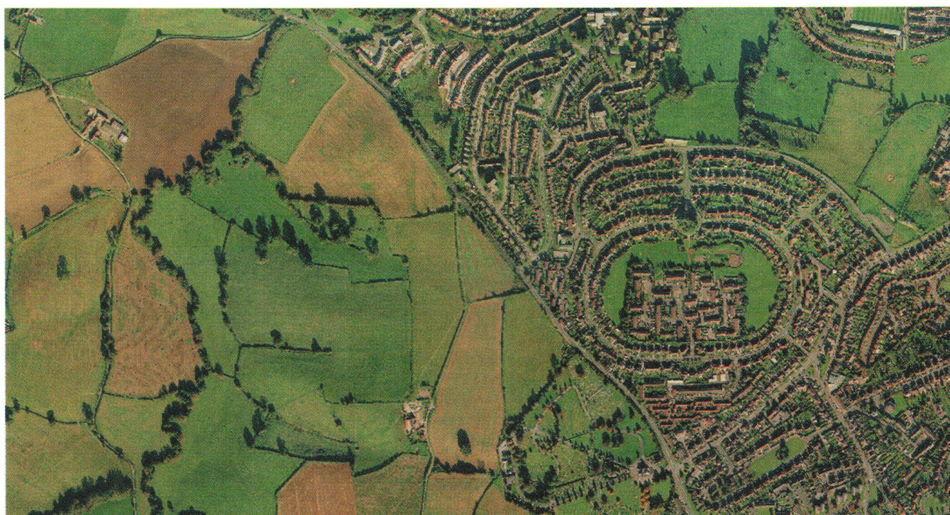
Fig. 1: Extrait de la mosaïque de Bath (Est de Bristol).

L'Angleterre n'est malheureusement pas le pays le plus ensoleillé d'Europe, ce qui rend l'acquisition des photographies aériennes assez laborieuse. Pour contourner ce problème, le consortium dispose de cinq avions bimoteurs affectés uniquement à ce projet. De cette manière, chaque période favorable aux prises de vue photogrammétriques peut être ex-