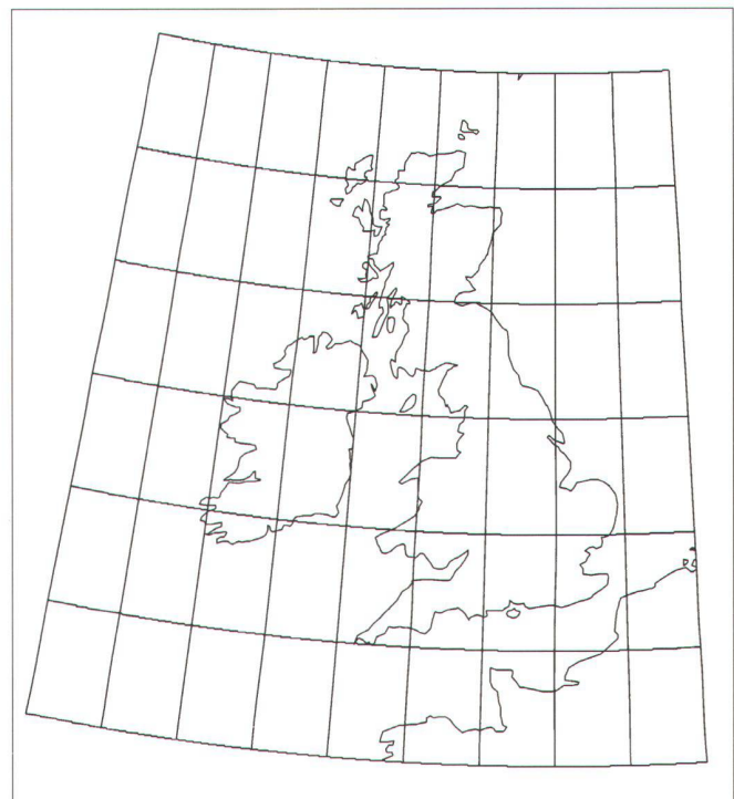
Abb. 2: Beispiel eines online berechneten Kartennetzes mit frei erhältlichen WDB-Daten (flächentreue konische Abbildung mit längentreuem Parallelkreis auf 54° nördlicher Breite, 2° Maschenweite).