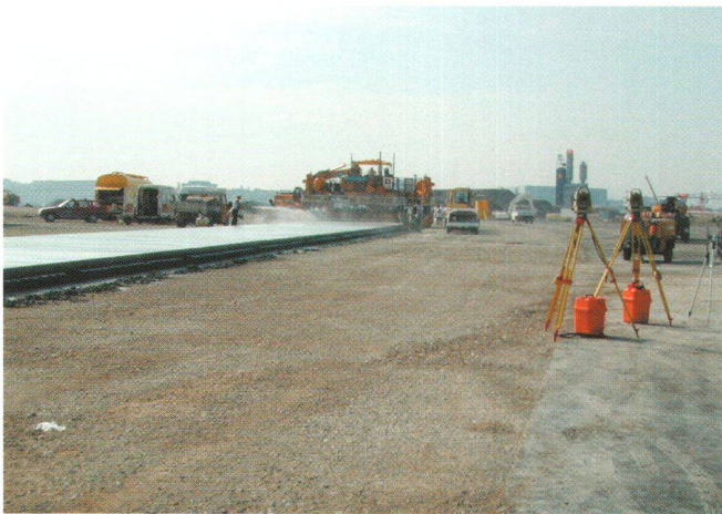
Abb 1: GOMACO Beton-Gleitschalungsfertiger gesteuert durch das Leica Maschinenleitsystem.

freie Stationierungen und nachträgliche Kontrollmessungen) erfolgt durch das Ingenieur- und Planungsbüro Schällibaum AG mit Hilfe vom TPS (Theodoliten-Positionierungs-System) Totalstationen TCA2003, zusammen mit der Fernsteuerung RCS1100. Bei Bedarf auch im «Einmann-Modus».