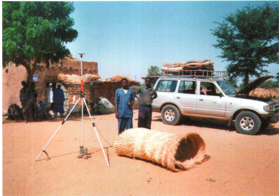
Fig. 2: Récepteur GPS sur un point fixe.

Sur le terrain, les points fixes sont matérialisés par des piliers préfabriqués en tubes PVC de 15 cm de diamètre pour une longueur de 60 cm. Ces tubes sont rem-