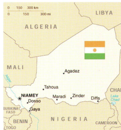
Fig. 1: La République du Niger.

Dans le cadre des plans de développement économique et social, le gouvernement de la République du Niger donne la priorité à la recherche de l'autosuffisance alimentaire, à la lutte contre la désertification et à la restauration de l'environnement. Plusieurs projets de développement ont été mis en place, notamment en ce qui concerne l'agriculture, l'élevage, le reboisement et l'exploitation des eaux sou-