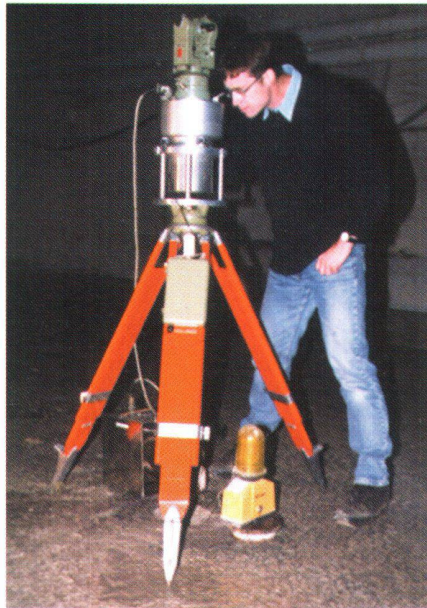
Abb. 2: Gyromat-Messungen im Zimmerbergtunnel.

Beobachtungsschema eingehalten werden. Zur Festlegung der Referenzlinie – ca. 390 m lang – wurden zwei Fixpunkte des Grundlagennetzes in der Nähe des Lüftungsschachtes Lätten bei Zürich-Wollishofen ausgewählt. Diese durch Bodenpunkte vermarkte Linie liegt in leichter Hanglage und ist bei bestimmten Witterungsbedingungen schwach refraktionsgefährdet. So konnten refraktionsbedingte Differenzen zwischen Hin- und Rückmessung von 2 mgon signifikant festgestellt werden.