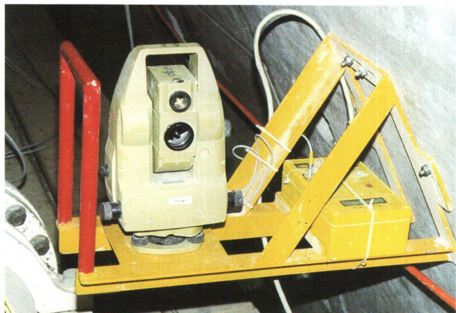
Fig. 1: Stazione VMT con Leica TCA 1100 e Yellow Box.