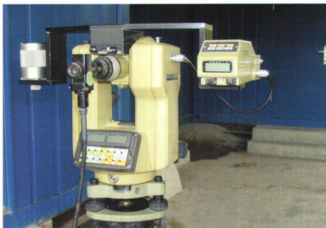
Fig. 2: Sistema di guida ZED-260 con teodolite 71000.

segue automaticamente un bersaglio di posizione nota montato sulla fresa, i dati delle misurazioni vengono continuamente inviati per l'elaborazione ad un Laptop nella cabina di comando.