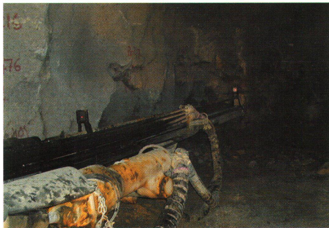
Fig. 5: Fresa con le due tavole di puntaggio.

Il programma ACS-II costituisce il nodo del sistema e a partire da tutti i dati che gli vengono inviati calcola la posizione esatta e la tendenza di avanzamento della fresa, degli anelli montati nonché le correzioni da apportare agli anelli stessi e alla lunghezza dei pistoni. Il tutto viene mostrato su di un monitor sotto forma numerica e grafica, e girando il programma sotto Windows è estremamente amichevole e facile da gestire.