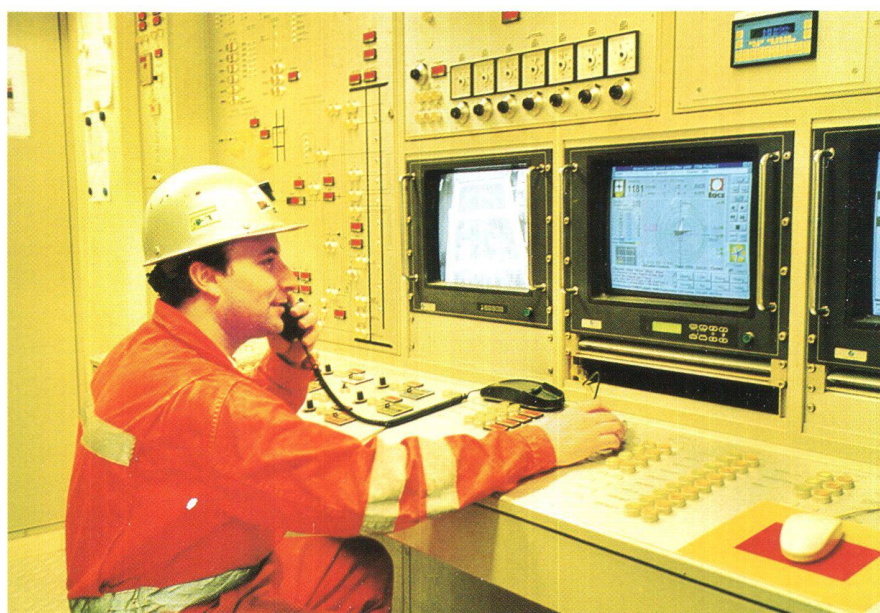
Fig. 3: PC VMT nella cabina di guida.

Dal PC è possibile orientare il teodolite, inoltre si possono determinare le coordinate della mensola successiva su cui lo stesso teodolite verrà, con l'avanzamento della fresa successivamente montato, naturalmente queste misurazioni vengono controllate dal geometra con un altro teodolite, si è però potuto constatare che le differenze sono nulle o minime, contenute in qualche mm.