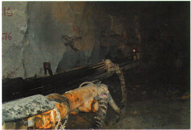
Fig. 5: Fresa con le due tavole di puntaggio.

Il programma ACS-II costituisce il nodo del sistema e a partire da tutti i dati che gli vengono inviati calcola la posizione esatta e la tendenza di avanzamento della fresa, degli anelli montati nonché le correzioni da apportare agli anelli stessi e alla lunghezza dei pistoni. Il tutto viene mostrato su di un monitor sotto forma numerica e grafica, e girando il programma sotto Windows è estremamente amichevole e facile da gestire.