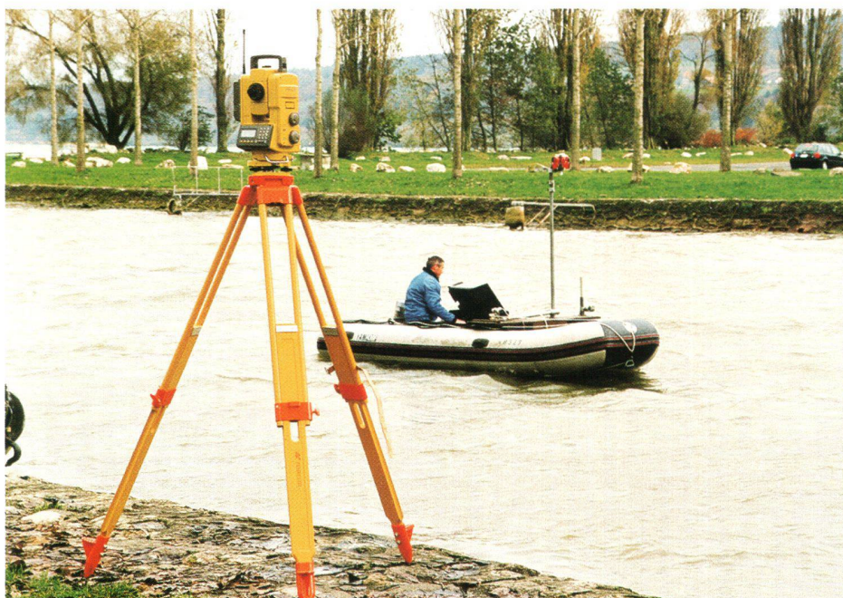
Fig. 3: L'opérateur reçoit en temps réel sa position, ce qui lui permet de naviguer avec précision sur le profil à lever.

Ce procédé ressemble de prêt aux mesures GPS temps réel, mode cinématique. L'avantage d'un instrument automatique par rapport à un système GPS dans le cas précis de ce mandat est évi-