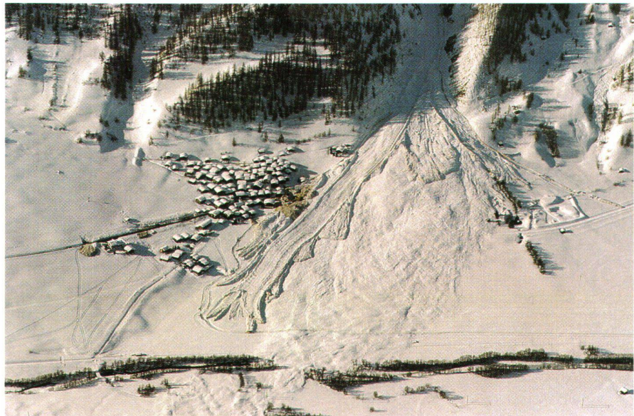
Abb. 1: Mehrere Lawinen aus dem gleichen Tobel haben in Geschinen (VS) Menschenopfer gefordert und grossen Sachschaden angerichtet. Wie hier sind auch an anderen Stellen im Goms die Lawinen von beiden Talflanken in der Mitte zusammengestossen.

Bei den ausserordentlichen Unwetterereignissen von 1987 und 1993 haben die betroffenen Kantone, unterstützt von ihren Parlamentariern, von Beginn weg die Schaffung von Sonderrecht im Rahmen eines dringlichen Bundesbeschlusses angestrebt und erwirkt. Dabei sind Bereiche ohne gesetzliche Regelung in den Genuss einer Bundesunterstützung gekommen und zusätzliche Beiträge an die Restkosten gesprochen worden. Die Restkostenfinanzierung wurde mit den beträchtlichen Unterschieden in den Beitragsätzen der verschiedenen geltenden Gesetze begründet.