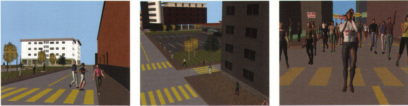
Fig. 2-4: Simulation de piétons et d'une manifestation.

ENVs avec des points d'entrée/sortie pour quitter et entrer dans une nouvelle surface selon le type de mobile et la sémantique attachée aux zones. Un piéton ne peut pas utiliser une voie réservée aux bus pour marcher, par exemple. Au niveau de la rue, un chemin pour piéton passe par des trottoirs, des passages à piétons et autres voies. Nous avons donc des types de graphes différents suivant les entités, mais des ENV permettant une connexion entre graphes. Ainsi, les arrêts de bus sont les liens entre les graphes pour les piétons et ceux pour les bus. Pour définir un chemin spécifique, l'utilisateur peut utiliser l'interface que nous avons développée.