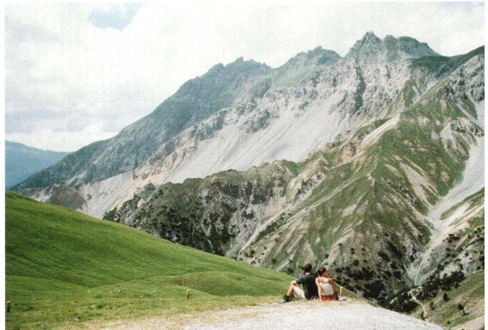
Abb. 1: Ruhepause auf Margunet im Schweizerischen Nationalpark (ca. 2300 mü.M.). Mit etwas Glück lassen sich in diesem Gebiet Bartgeier beobachten.

Dabei ist in erster Linie an wissenschaftli-