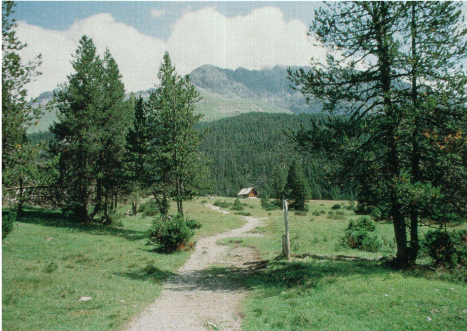
Abb. 2: Ein beliebter Wanderweg im Gebiet Il Fuorn (Schweizerischer Nationalpark) führt unter anderem an der ehemaligen Alp Stabelchod vorbei. Er ist als Naturlehrpfad eingerichtet.