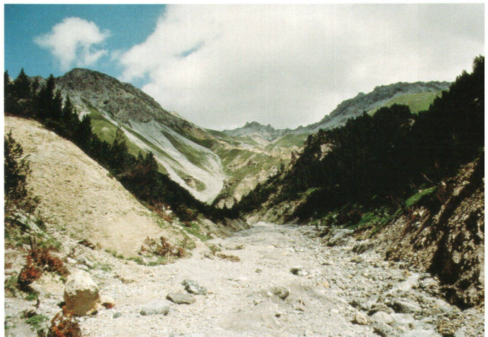
Abb. 3: Der Schweizerische Nationalpark stellt ein Totalreservat dar, in dem die Natur sich selbst überlassen wird.

Vergrößerung der regionalen Multiplikatorwirkungen: Für die Unternehmungen in der Region bedeutet dies, dass sie bewusst in noch grösserem Umfang als bisher Vorleistungen aus der Region beziehen und bei Investitionen die Aufträge an in der Region ansässige Firmen vergeben. Analoges gilt auch für die Konsum- und Investitionsentscheide von privaten Haushalten.